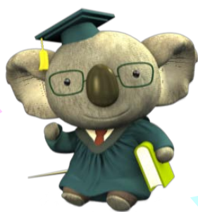
関西大学図書館 マスコットキャラクター 『コアラ博士』

データベース講座は実習問題もあり、通常のガイダンスでは紹介できていない、一段階上の情報検索スキルや、検索した情報の活用法を意識できる内容となっています！