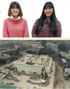
校中の総合図書館