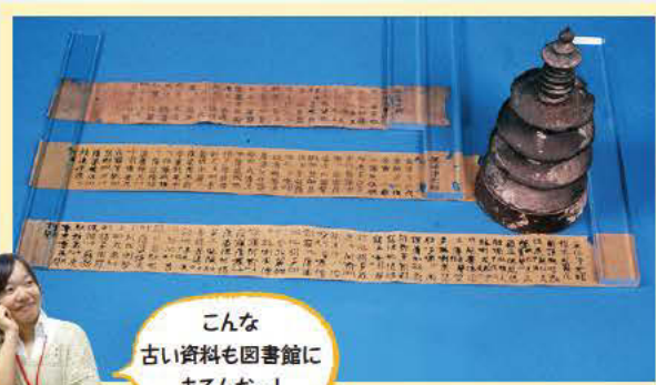
こんな 古い資料も図書館に あるんだー!

発行年が明確なものなかでは、770年に完成された、この百万塔陀羅尼となります。これは、印刷された年代が明確な世界最古の印刷物とされているんです。こんなに古い資料を保存しているとは驚きですね!