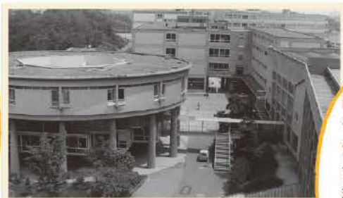
専門図書館と渡り廊下

昭和39(1964)年9月、千里山キャンパスにおける第2の図書館として竣工。千里山図書館が、法・文両学部学舎の近くにあったため、主として、経済・商・工各学部の教員と、専門課程の学生を対象として建築された。