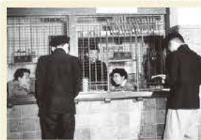
奉仕室カウンター