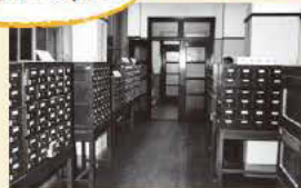
天六分館の目録室