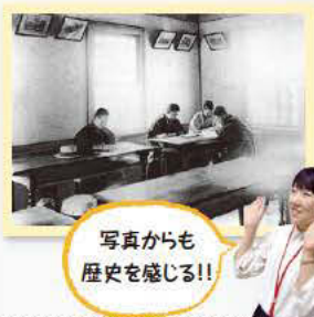
写真からも 歴史を感じる!!

大正3(1914)年、本学初の独立した図書館が設置されました。当時の図書館はわずか20坪の土地に建てていました。それでも学生たちは、読書や研究に打ち込んだのですね!