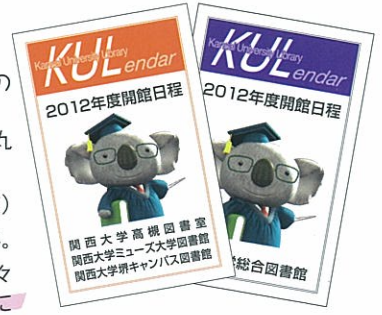
コアラ博士が表紙を飾る開館カレンダー